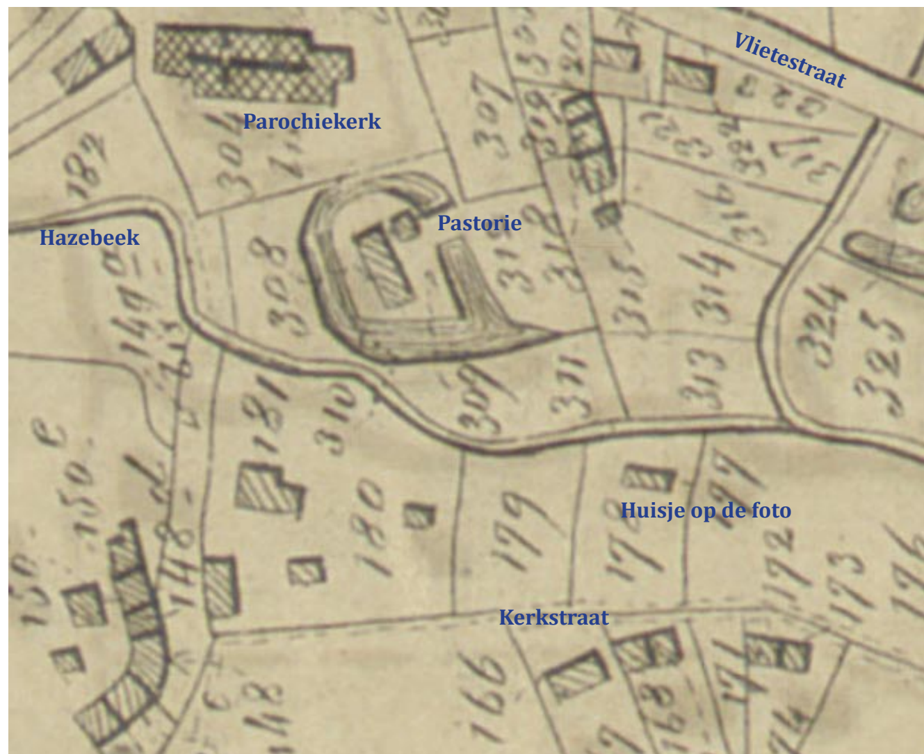
Detail uit de Popp kaart (1852) met uiteraard nog de oude kerk en de vroegere pastorie die nog omwald was.