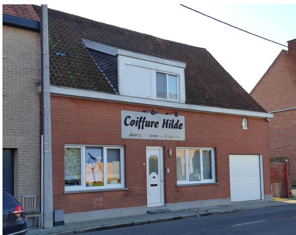
Sint Krispijn in 2018